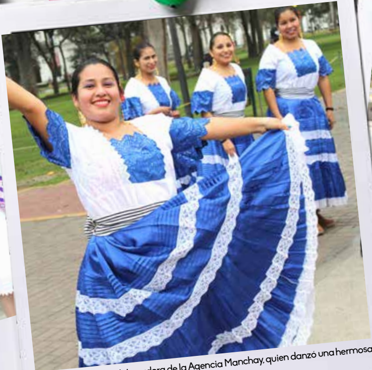
Bella cortesana y colaboradora de la Agencia Manchay, quien danzó una hermosa marinera norteña.