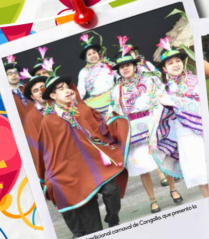
Hermoso y tradicional carnaval de Congalla, que presentó la Agencia Barranca.