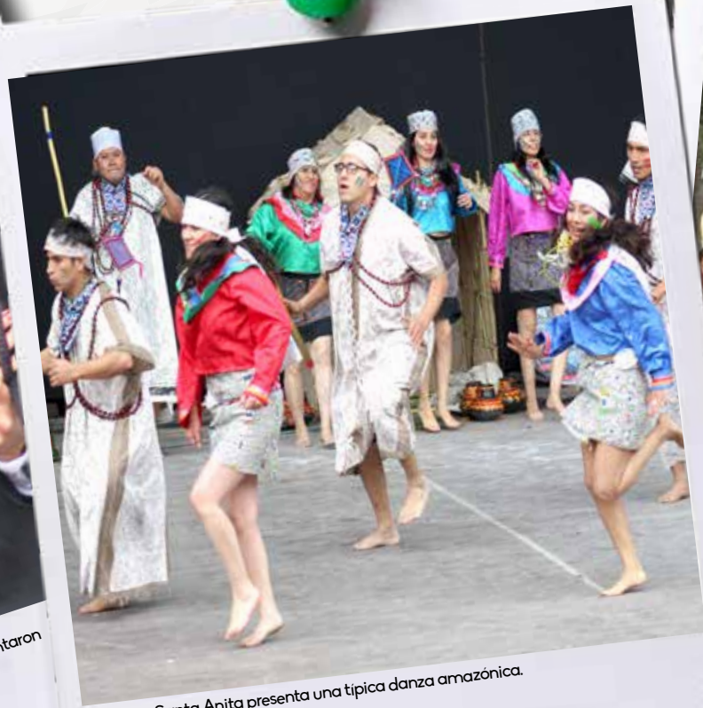
Agencia Santa Anita presenta una típica danza amazónica.