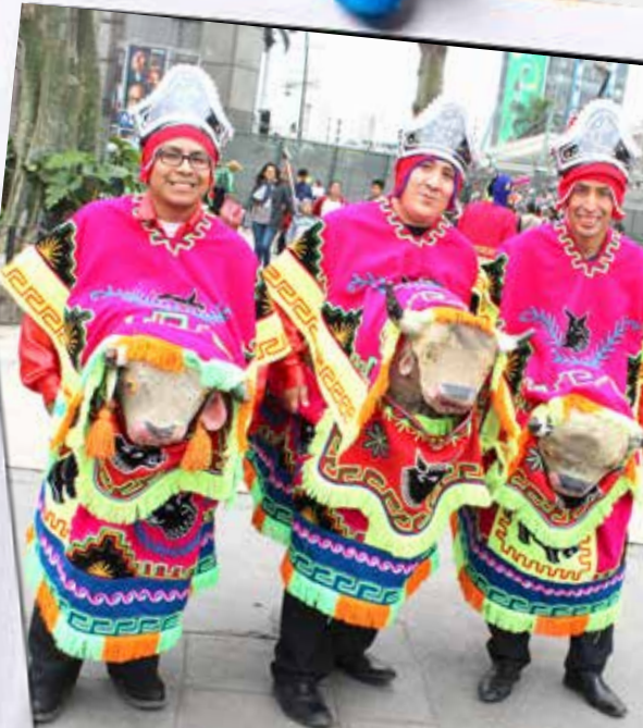
Cada agencia se esforzó para presentar lo mejor del acervo cultural del Perú y lo lograron.