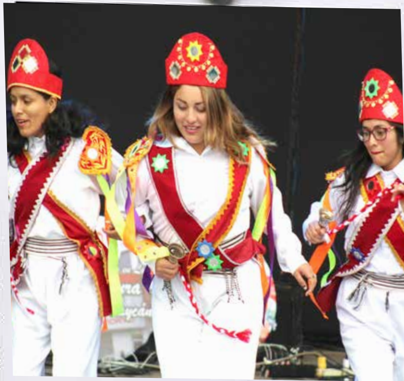
Agencia Carapongo, presentó la danza "Atajo de Negritos" afincados en los esclavos del sur limeño.

COLABORADORES DE TODAS LAS AGENCIAS, PRESENTARON DIVERSAS DANZAS TÍPICAS EN OCHO CIUDADES