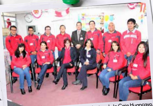
Equipo en pleno de la Gerencia de Marketing de la Caja Huancayo, verdaderos artífices del posicionamiento de la marca en todo el país.