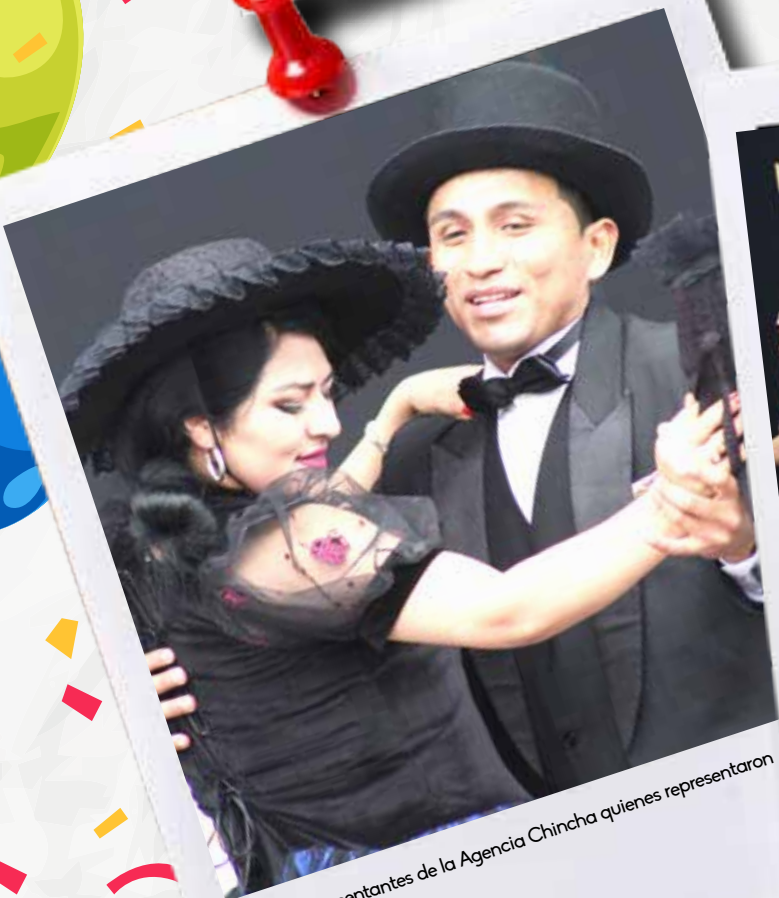
Dignos representantes de la Agencia Chíncha quienes representaron una polka limeña.