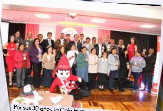
Por sus 30 años, la Caja Huancayo reconoció a 30 emprendedores de la región que se caracterizaron por crecido con la institución financiera.