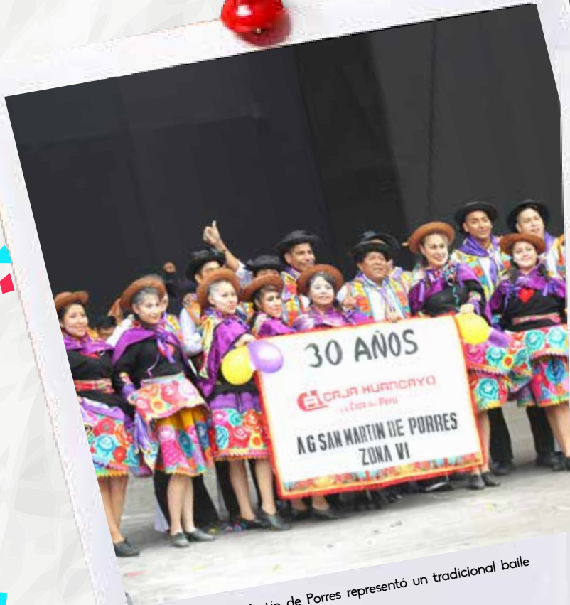
La Agencia San Martín de Porres representó un tradicional baile andino.