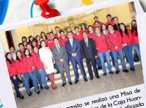
El miércoles 8 de agosto se realizó una Misa de Agradecimiento por los 30 años de la Caja Huancayo en la Basílica Catedral de la ciudad, oficiada por el Excelentísimo Monseñor Arzobispo Metropolitano de Huancayo, Pedro Ricardo Barreto Jimeno, flamante Cardenal de la Iglesia Católica.