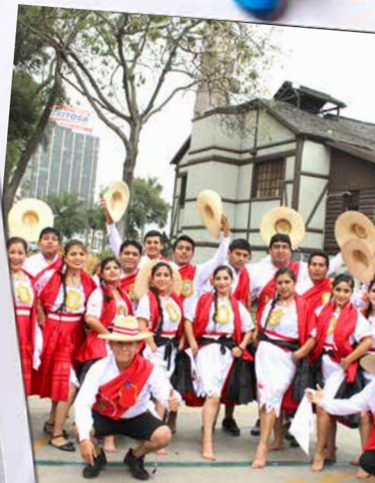
Participantes de la Agencia Huaycán. Al igual que las impresionaron con sus atuendos y danzas. Excelente p tondero lambayecano.