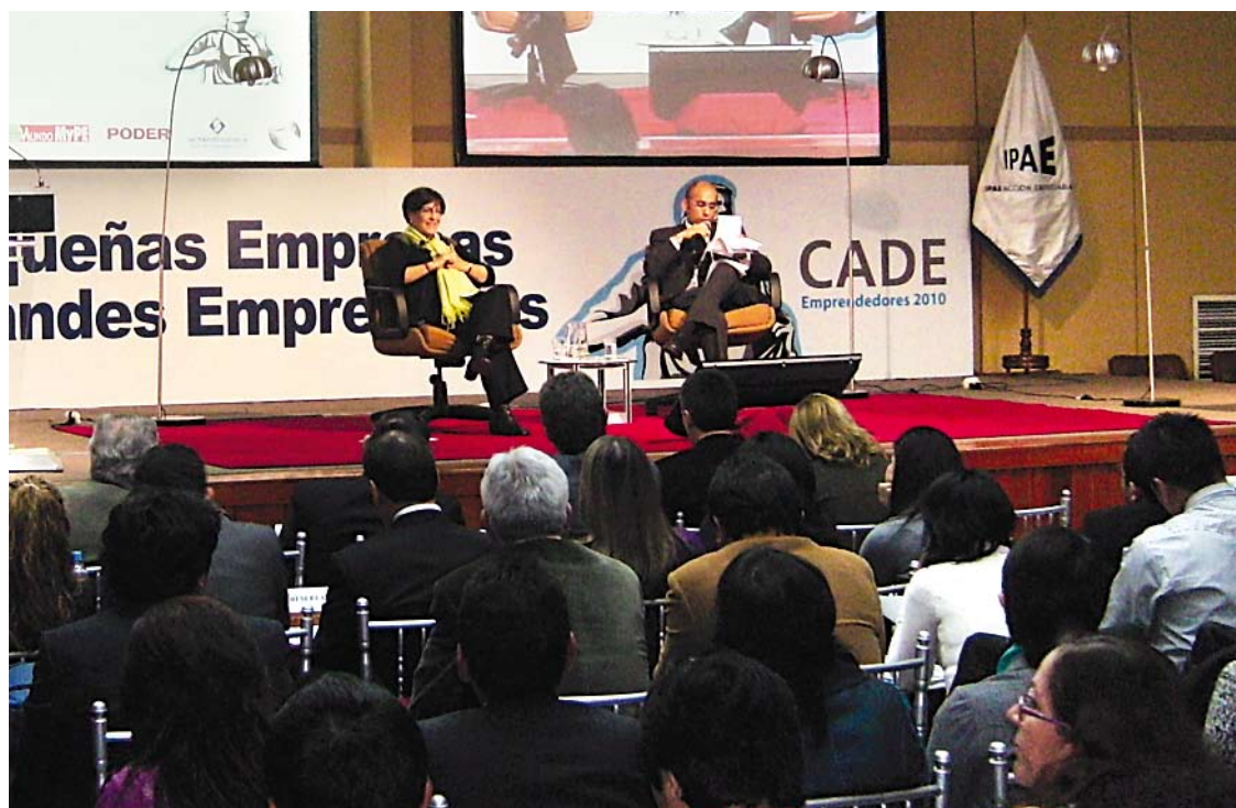
En la CADE Emprendedores participaron las dos candidatas que están liderando las encuestas para la alcaldía de Lima.