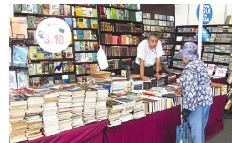
La participación en diversas ferias de libros y la producción intelectual es fundamental para docentes y estudiantes.

Esta distinción se alcanzó luego de un largo proceso de evaluación para comprobar la alta calidad académica del programa de Ingeniería Industrial que se logró como resultado del esfuerzo excepcional de todos los estamentos de la facultad, así como por el proceso de autoevaluación para la implementación de las mejoras necesarias para alcanzar un adecuado nivel de calidad.