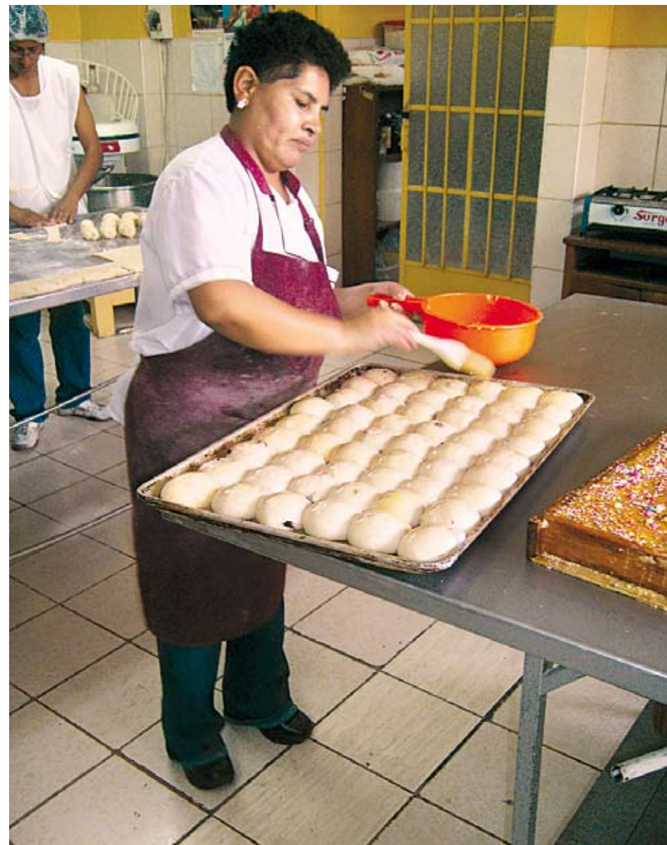
La Facultad de Ingeniería Industrial tiene sus propias actividades empresariales y emprendedoras. Posee una panadería, donde no sólo es la tienda, sino que los propios alumnos aprenden a ser empresarios.