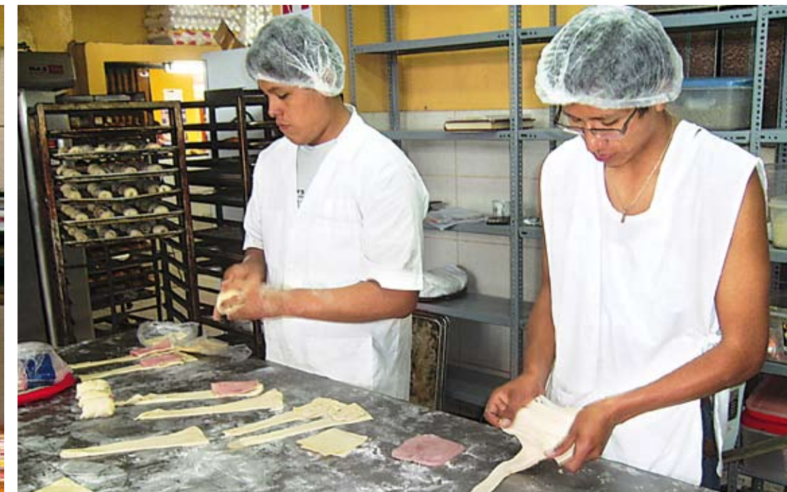
Alumnos de la Facultad de Ingeniería Industrial en pleno proceso de aprendizaje práctico.

Esta distinción se alcanzó luego de un largo proceso de evaluación para comprobar la alta calidad académica del programa de Ingeniería Industrial que se logró como resultado del esfuerzo excepcional de todos los estamentos de la facultad, así como por el proceso de autoevaluación para la implementación de las mejoras necesarias para alcanzar un adecuado nivel de calidad.