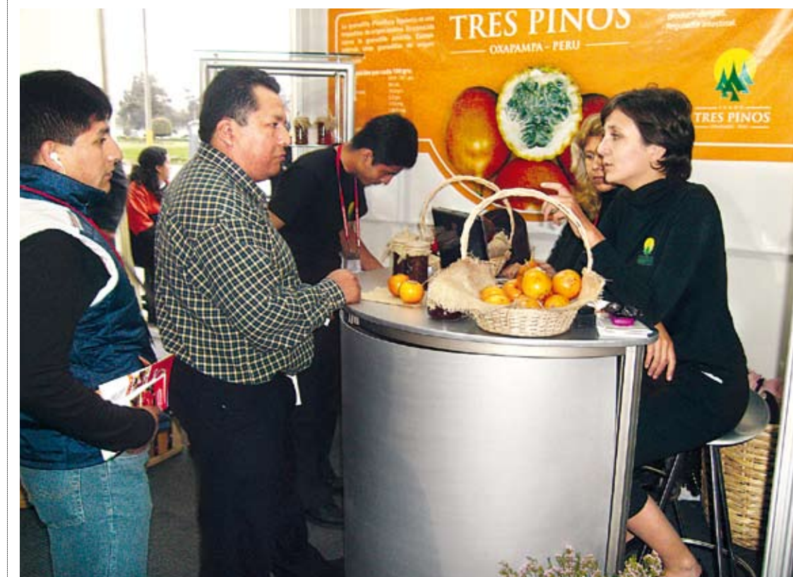
Representantes de treinta países estarán participando en la Feria Expoalimentaria 2010, considerada la más grande e importante del país.

Nuevamente, los ojos del mundo estarán hoy en el Perú, La Feria Internacional Expoalimentaria 2010 se inicia y se realizarán convenciones especializadas, ruedas de negocio y "Cocina Demo" en el que connotados chefs prepararán platillos con productos de exportación. Treinta países estarán en la feria.