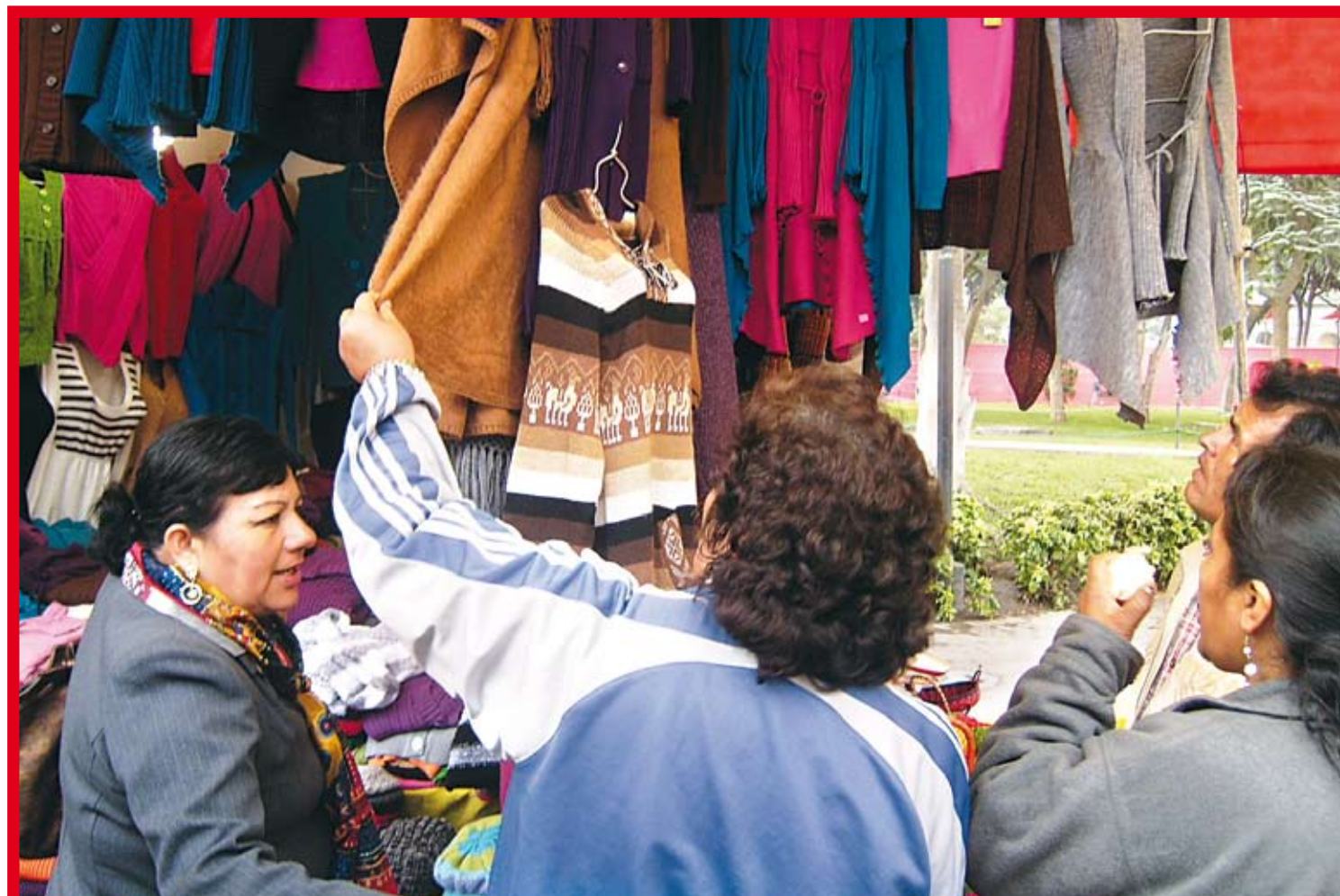
La microempresa viene desarrollándose en América Latina, gracias al apoyo de las instituciones microfinancieras.