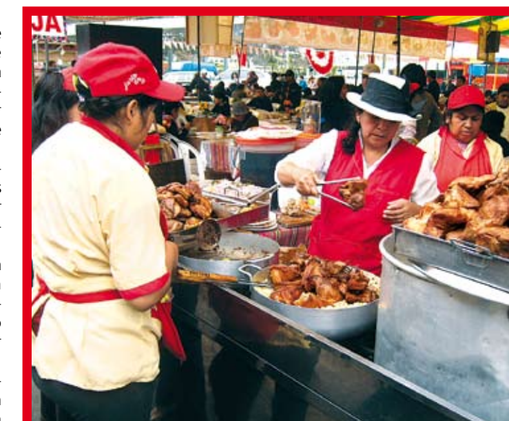
La adecuada atención y buen servicio al cliente son el binomio del éxito empresarial.

Cada día se comprueba que el éxito de los negocios, no sólo está en la buena calidad del producto ni en los mercados adecuados, sino también en la correcta atención y servicio a los clientes.