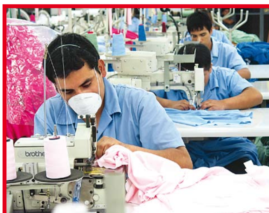
La pobreza se combate con fomentar el apoyo a la microempresa.

En el ámbito de las cooperativas de ahorro y crédito, el FOMIN desarrolló diversos proyectos en la región, siendo uno de ellos el de incrementar el acceso al financiamiento de la población microempresarial a través de las cooperativas de ahorro y crédito de primer piso de Ecuador. En Bolivia, se busca ampliar el acceso al crédito y servicios no financieros del productor agrícola actualmente excluido del acceso a estos servicios, a través de la profundización y expansión de los servicios integrales de la IFD Sembrar Sartawi.