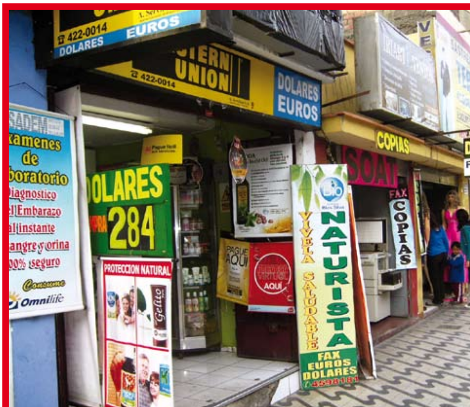
Las MYPE son la fuente del desarrollo social de los pueblos de la región.