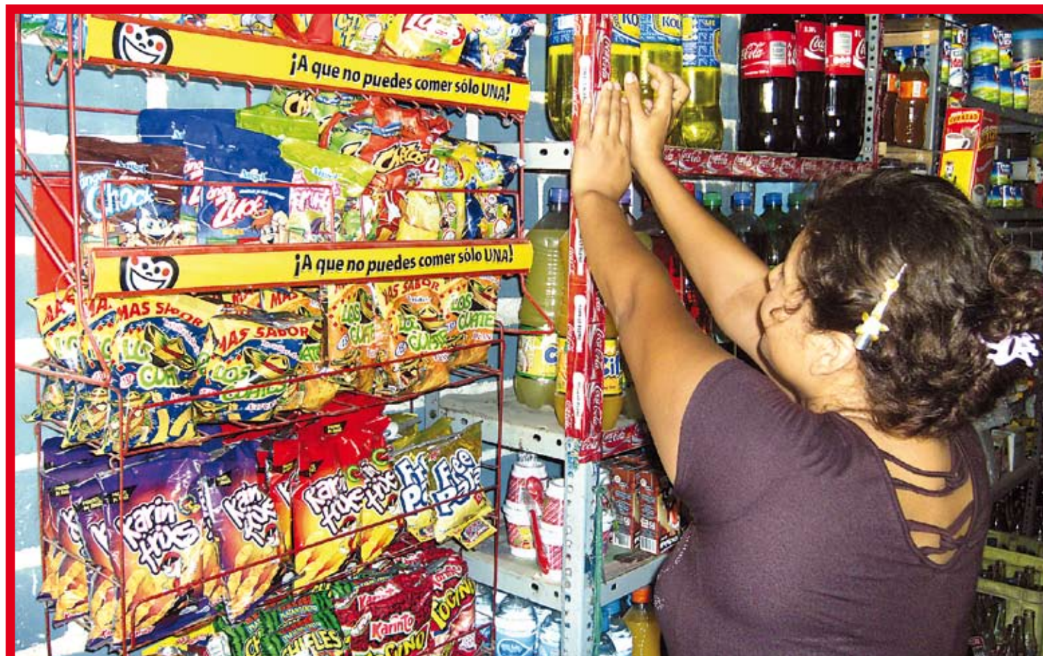
La pequeñas empresas crecen por el aporte financiero de las cajas de ahorro y crédito en diversas partes del mundo, pero en el Perú, fundamentalmente por la industria microfinanciera, basada en el sistema de cajas municipales.