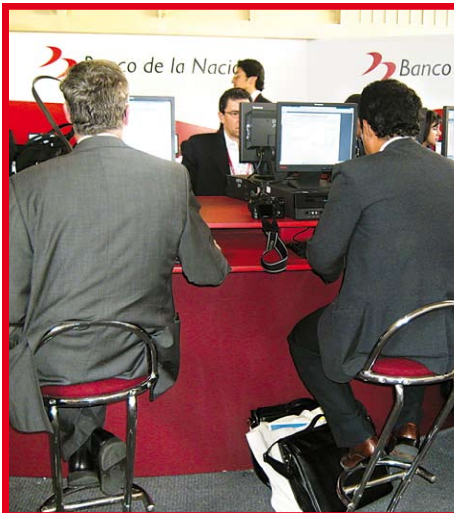
Hay una gran necesidad de contar con mayor entrenamiento para competir en óptimas condiciones en el mundo empresarial, especialmente en las microfinanzas.