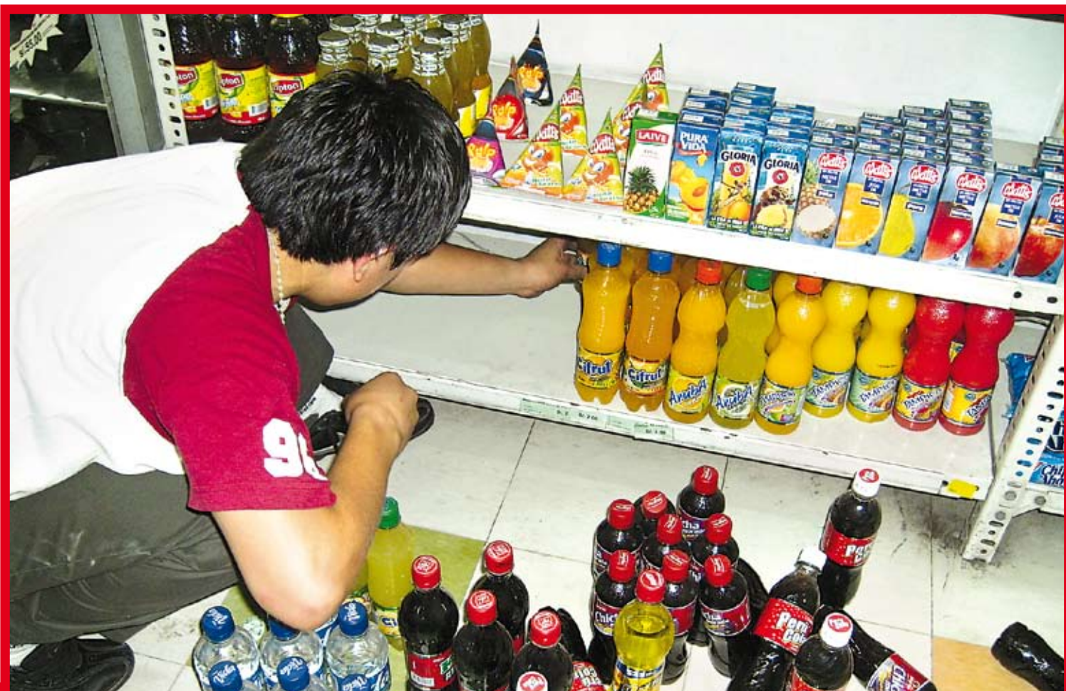
Los controles no sólo deben partir de la gerencia, sino del personal, porque es responsabilidad de todos.