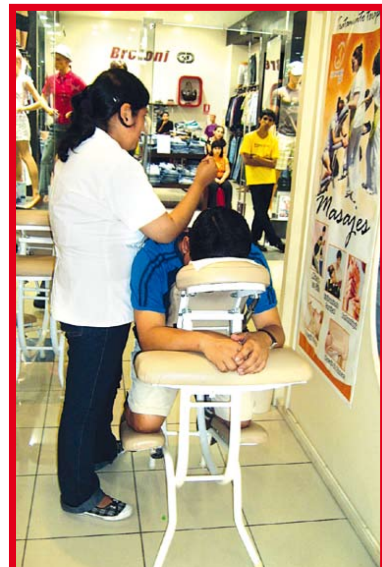
Cientos de emprendedores son beneficiados por la Caja Sullana.

La Caja Municipal de Sullana (CMAC- Sullana) dio a conocer sus principales resultados económicos al cierre del año 2009, tanto en colocaciones como captaciones, donde destaca la generación de más de 32 millones de nuevos soles en utilidades, la ampliación de su cobertura geográfica a nueve departamentos del Perú y el liderazgo que mantienen en el ámbito de cajas en los mercados en los departamentos de Piura, Tumbes y Lima, según Joel Siancas Ramírez, presidente de esa entidad financiera.