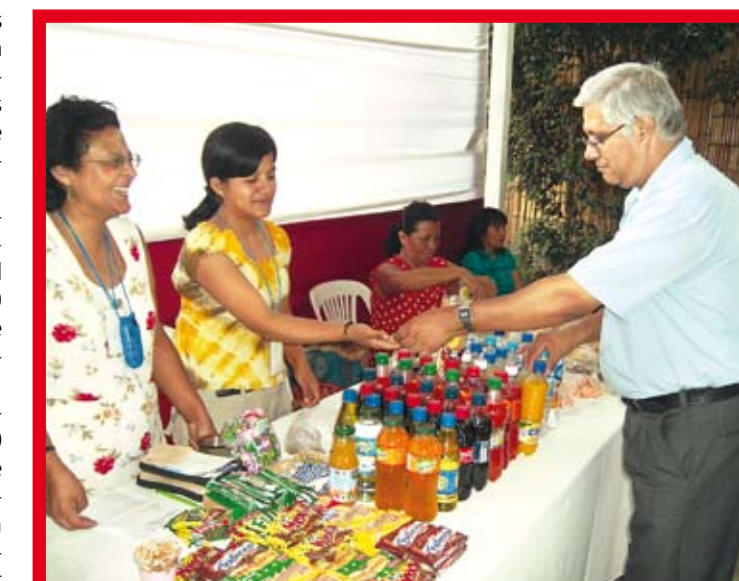
Los docentes de la Derrama Magisterial tendrán financiamiento para sus pequeños negocios.

Los docentes miembros de la Derrama Magisterial (DM) accederán a diversos créditos para iniciar negocios propios o fortalecer sus pequeñas empresas según las últimas decisiones de esa entidad gremial que agrupa a más de 270 mil maestros.