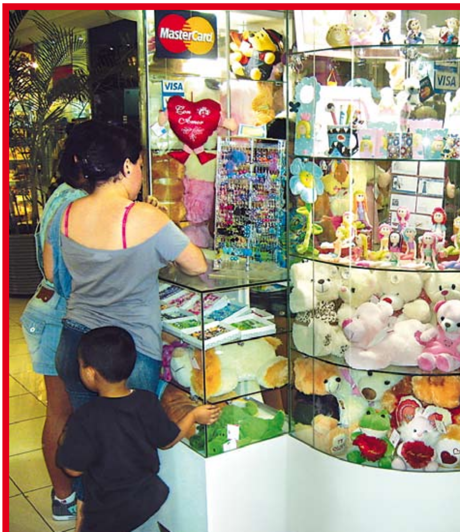
La aplicación de adecuados controles internos es clave para cualquier organización.