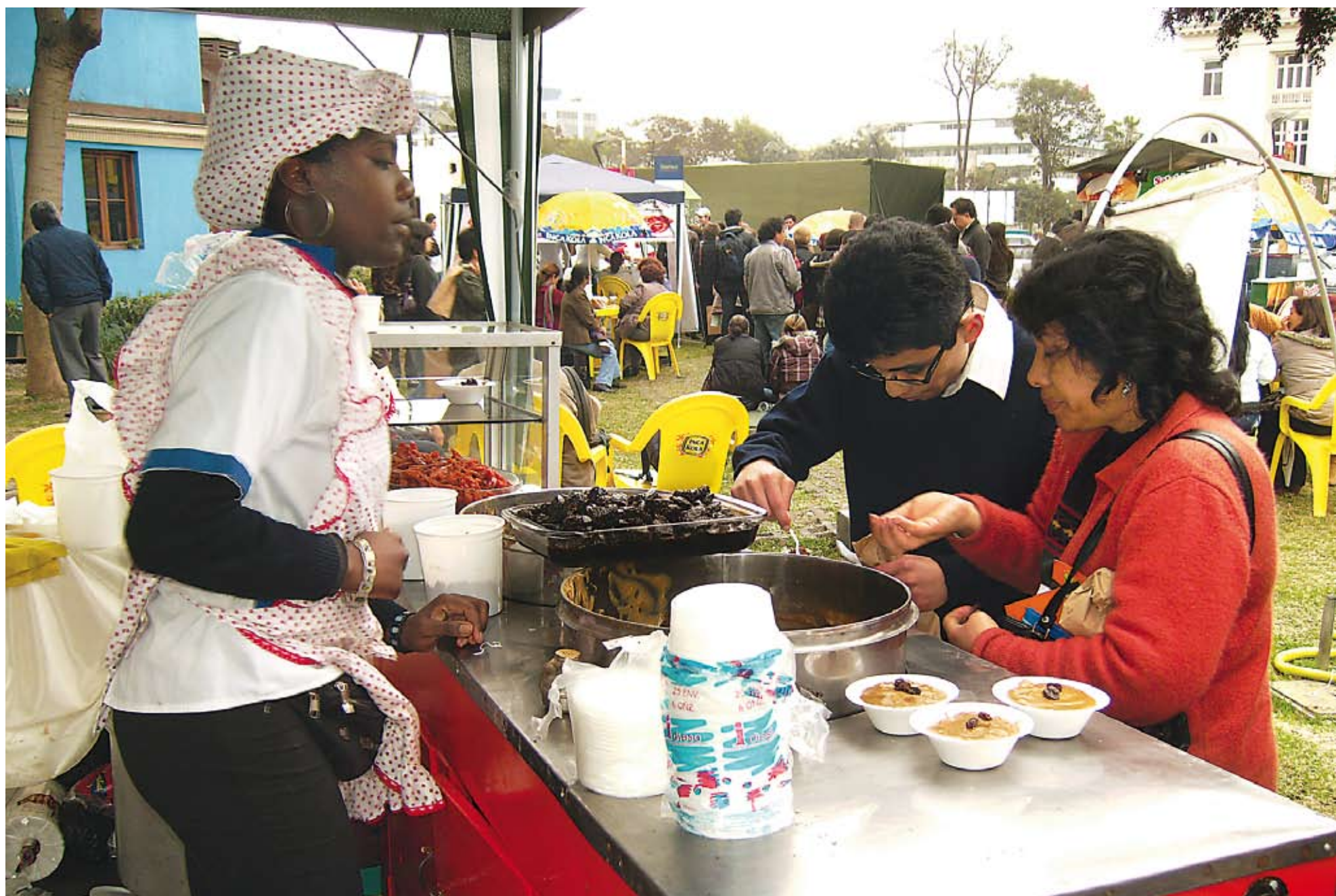
La industria microfinanciera ha ayudado a miles de peruanos a crear sus propios empleos.

POLÍTICAS PÚBLICAS DEBEN USAR MICROFINANZAS COMO HERRAMIENTA SOCIAL