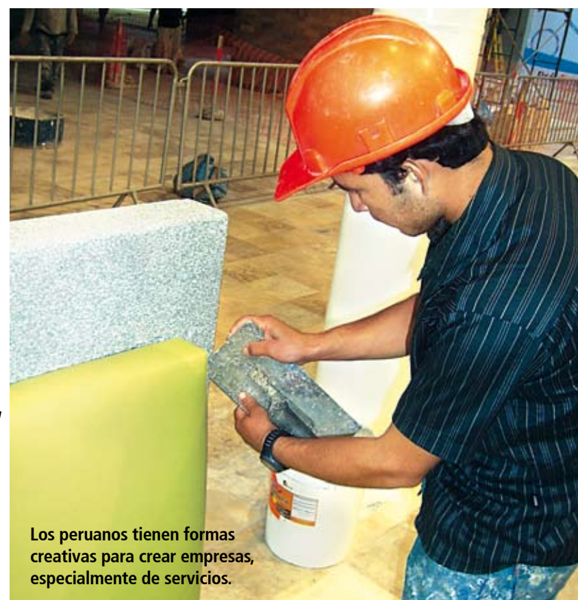
Los peruanos tienen formas creativas para crear empresas, especialmente de servicios.