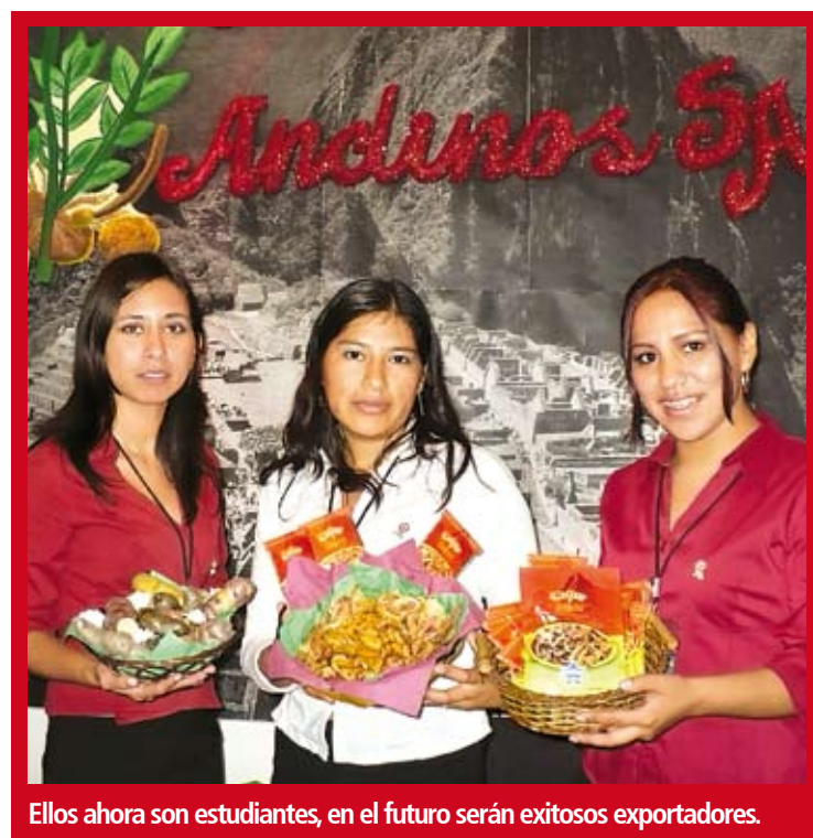
Ellos ahora son estudiantes, en el futuro serán exitosos exportadores.

Uno de los objetivos que deberían tener las instituciones académicas es orientar sus programas de estudios empresariales hacia las exportaciones. El próximo 20 de diciembre, un grupo de estudiantes participarán en la Feria ADEX, mostrando sus primeros frutos para ingresar al fabuloso mundo de las exportaciones.