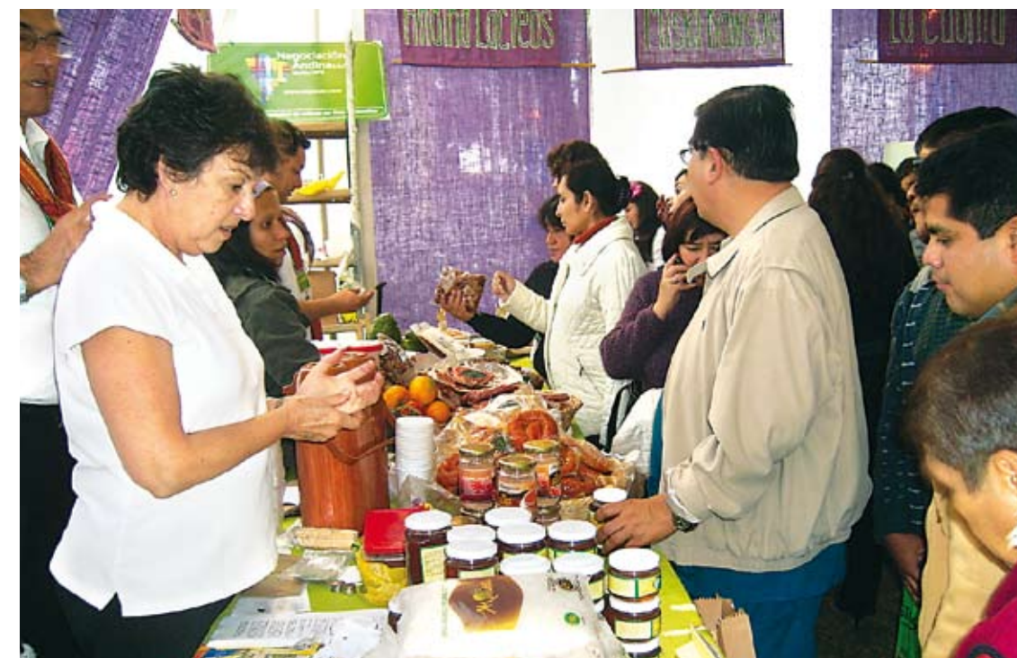
Diversas facetas de producción laboral entre los peruanos.

Asimismo, la pobreza genera otros tipos de secuelas y limitaciones. Deficiente niveles de salud y educación, escasas posibilidades de desarrollo social, y lacras sociales, son parte de las funestas consecuencias. De ahí que los organismos internacionales de desarrollo social como el Banco Mundial y Banco Interamericano de Desarrollo, recomienden que la estrategia más eficiente para crecer y reducir la pobreza en la mayoría de los países latinoamericanos debe ser una combinación de políticas que busquen la aceleración del crecimiento económico con programas orientados directamente a reducir la pobreza y la desigualdad.