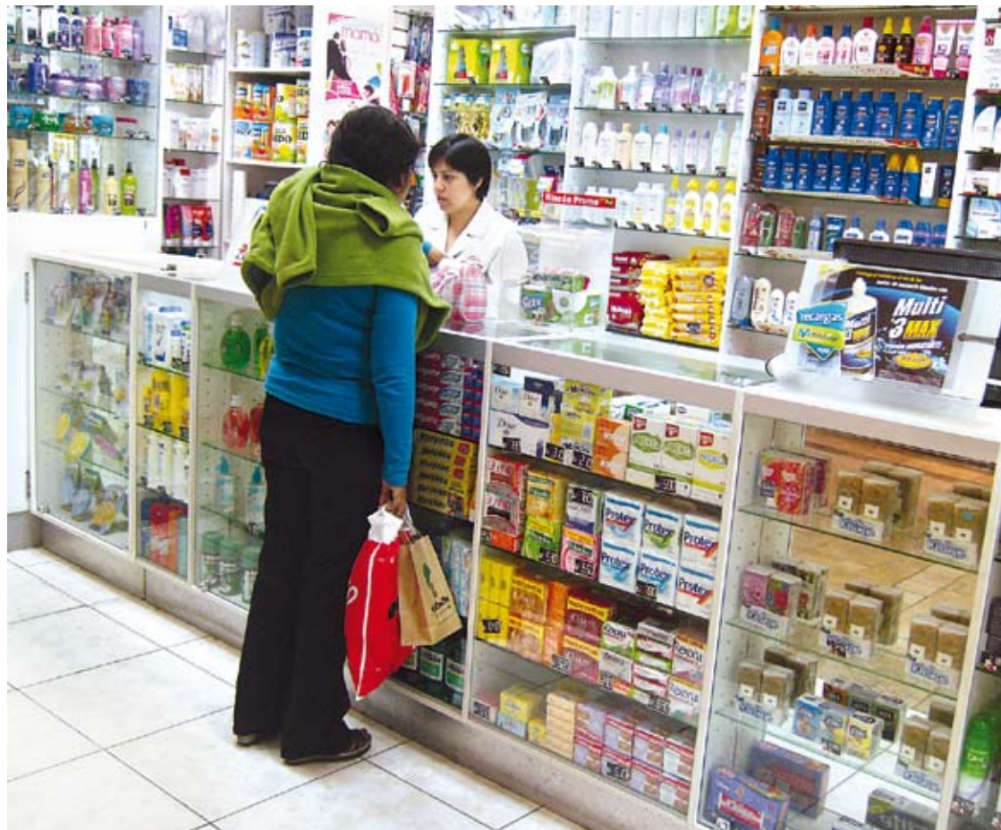
La salud es el bien máspreciado de la raza humana y su prevención es fundamental.

El hombre en su proceso de desarrollo se ha visto en la necesidad de utilizar cada vez más los recursos de la naturaleza y modificar su entorno. Desde esta óptica, entonces se infiere que la problemática del medio ambiente surge desde que aparece el hombre.