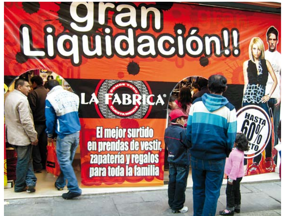
Los negocios harán sentir su importancia en el desarrollo económico del país.

"La actividad emprendedora en nuestro país representa el 42% del PBI nacional y el 82% del PEA, cifras que la colocan como la base fundamental de la economía del país. Los emprendedores dinamizan la economía, generan riqueza, empleos y desarrollo a todos los peruanos", destacó el representante del ANDE, Hernando "Nano" Guerra García, quien invitó a todos los emprendedores del país a que se sumen a esta iniciativa. Durante "El minuto emprendedor" se