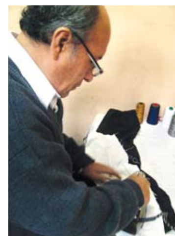
La interculturalidad supone la búsqueda de relaciones positivas entre personas de diferentes culturas.

La salud Visual, en particular, consiste en disfrutar de la mejor visión a través