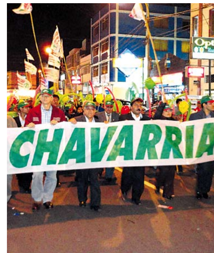
Su deseo es estar al servicio de los más necesitados de Lima Provincias, pretende transmitir su experiencia emprendedora a la población.

"Cuando era un niño, vivía en casa de unos parientes, porque la idea de mis padres era que yo estudiara. En cierta Navidad, llegó mi madre a visitarme y como era una fecha especial, mis tíos les habían comprado juguetes a mis primos. Le dije a mi madre que me comprara un carrito de juguete y mi madre me contestó que no tenía dinero, porque lo poco que tenía era para que yo estudiara. Esa frase marcó un hito en mi vida y por esa razón dediqué mi tiempo a estudiar. Ahora con la ayuda de Dios, dispongo de algunos autos".