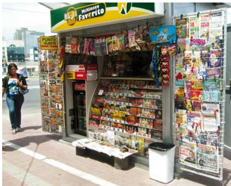
Las pequeñas empresas serán el motor del desarrollo de las provincias.

Es decir, el círculo virtuoso se reactivó y por ende, también la economía regional. Por cierto que ésta programación no fue una iniciativa pública, sino del sector privado. Se comprueba una vez más que con parámetros establecidos, la iniciativa privada es posible. Todos ganan. Gana el Estado mediante la mayor recaudación de impuestos, gana la empresa porque tendrá mayor rentabilidad y gana el trabajador por que accede a un puesto de trabajo, garantizándole a su familia una mejor calidad de vida y contribuyendo con la reducción de la extrema pobreza y generación de empleo.