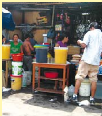
En los sectores populares, el buen uso del agua es fundamental para la vida humana.