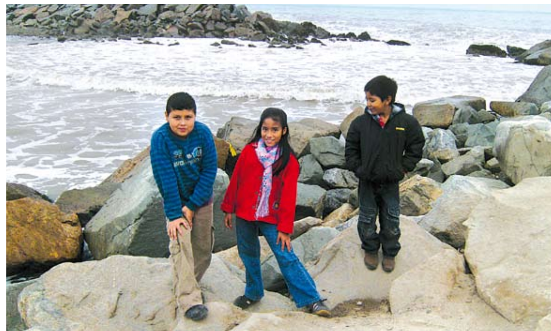
Según los especialistas, los niños son los más vulnerables a la adicción si no hay control y cuidado de sus padres.

Los niños y adolescentes son más vulnerables que los adultos y los adultos mayores frente a las dependencias al tabaco, el alcohol y otras adicciones, pues las regiones del cerebro que gobiernan el impulso y la motivación no están totalmente formadas a edades tempranas. La Estrategia Sanitaria Nacional de Salud Mental del Ministerio de Salud (Minsa) explicó que esta vulnerabilidad implica que el adolescente es mucho más susceptible de consumir drogas llevado por su entorno social y por la presión de sus compañeros. Por eso se recomendó que en caso de