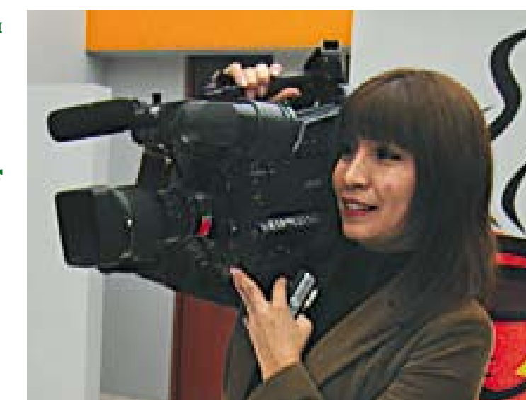
La participación de los medios de comunicación es imprescindible, pues acaparan un amplio espectro de la población, pero debe ser orientada con el objetivo de educar y no mal informar.

educativos adecuados, sin obviar el principio de equidad. A través de esta acción, la educación puede contribuir satisfactoriamente al incremento de la participación del individuo en la transformación de la sociedad y promover el desarrollo. Las transformaciones en el campo de la ciencia y la tecnología demandan