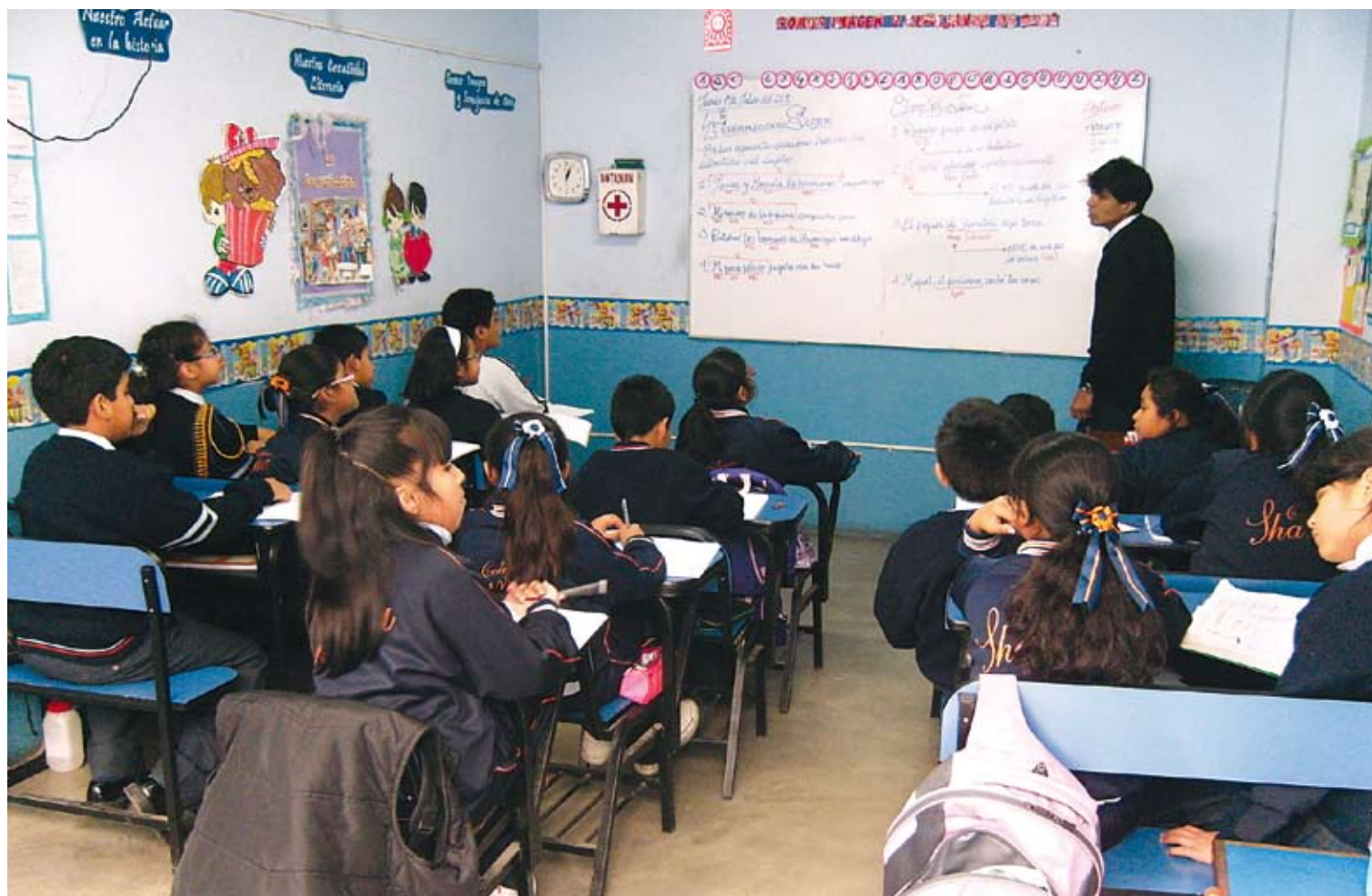
El desarrollo educativo y cultural de una comunidad es fundamental en la solidificación de una sociedad sentada sobre bases democráticas.