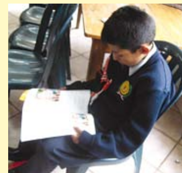
Leer libera no sólo la mente, sino también el alma.

Se deben planificar actividades para promocionar al Libro y estimular a los lectores especialmente a estudiantes, para que no acudan a sus bibliotecas y/o Internet solamente a copiar las tareas que el profesor propone sino que, lea y al mismo tiempo imagine fantasee, discierna y critique; así