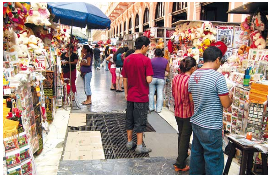
La interculturalidad supone la búsqueda de relaciones positivas entre personas de diferentes culturas.

La educación intercultural, debe entenderse en un proceso pedagógico que involucra a varios sistemas culturales. Nace del derecho individual y colectivo de los pueblos indígenas que conlleva, no solo gozar del derecho a la educación como todos los ciudadanos/as, sino también, el derecho de mantener y cultivar sus propias tradiciones, cultura, valores, pero también de la necesidad de desarrollar competencias interculturales que permitan a cualquier ciudadano de cualquier lugar del país pertenezca este a la cultura hegemónica o no, a poder convivir democráticamente con los otros. Una manera de pensar una propuesta de educación intercultural es abordándola desde los diferentes ámbitos de acción, sea éste hacia uno mismo y sus pertenencias (identidad), hacia el otro (convivencia), o hacia el mundo referencial (conocimiento). La interculturalidad supone la búsqueda de relaciones positivas entre personas de diferentes culturas, ello supone