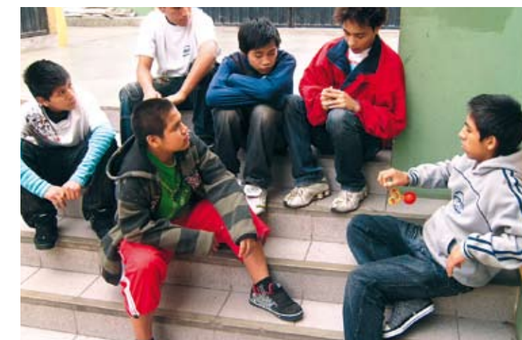
Urge que el Estado apoye iniciativas privadas que tengan nuevas propuestas educativas como son los centros de educación-albergues que en la mayor parte son patrocinados por instituciones particulares. El Centro Shama de los niños de la calle es uno de ellos.