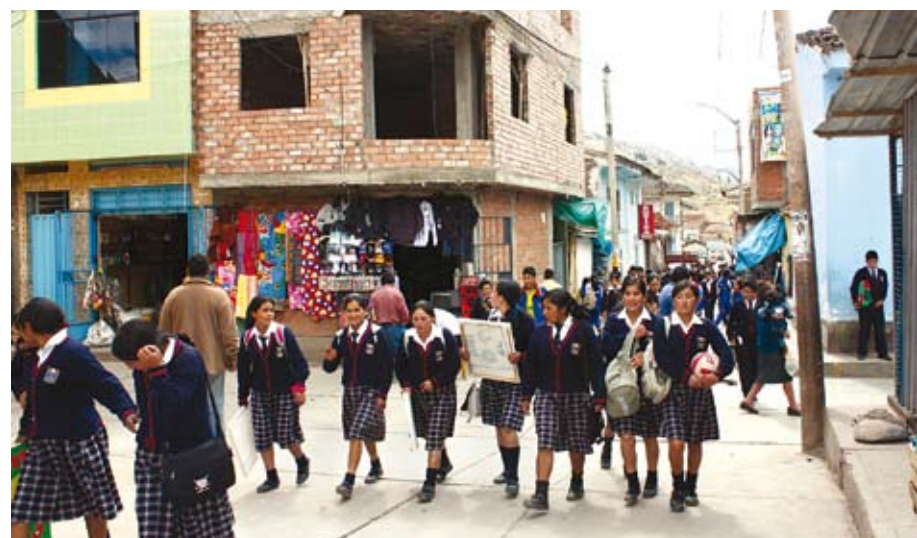
Es importante considerar que el desarrollo educativo y cultural consolida la conformación de sociedades integradas y participativas.