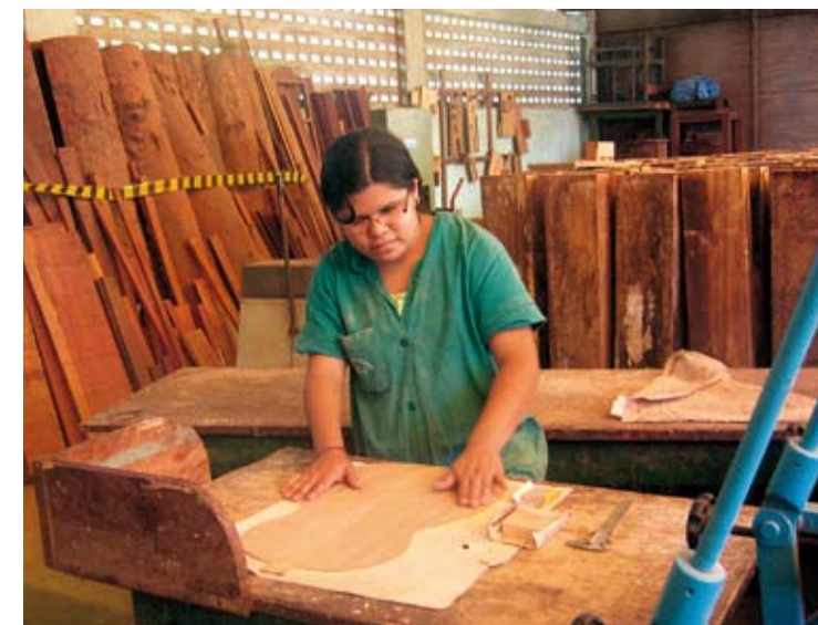
La industria maderera es una de las principales de la Amazonia.