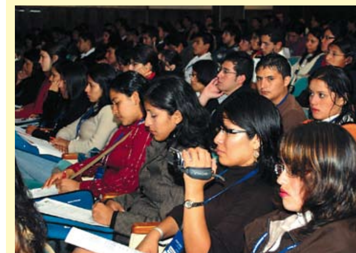
El progreso de un pueblo se mide por el nivel de felicidad de su gente, con la fuerza de los jóvenes se puede lograr muchas cosas.

Sobre la opinión de los jóvenes de cómo se puede modificar el sistema político para que éste resulte más equitativo, inclusivo y eficiente, la mayoría sostiene que debe ser gradual y a largo plazo. Un menor número de participantes opinó a favor de un cambio radical y vertical. Por otro lado, la mayor parte de los jóvenes puso énfasis en la importancia del esfuerzo individual como motor para el cambio. Es más: el factor esfuerzo individual primaba claramente sobre el institucional. Su confianza en un futuro mejor era imprecisa y bastante general, aunque no llegaba a constituir una visión pesimista. Finalmente, podemos señalar que este trabajo encuentra su mayor justificación en el llamado de atención hacia las responsabilidades de la sociedad para con sus nuevas generaciones. Las responsabilidades de los mayores sobre los jóvenes, en cambio, determinan su razón de ser.