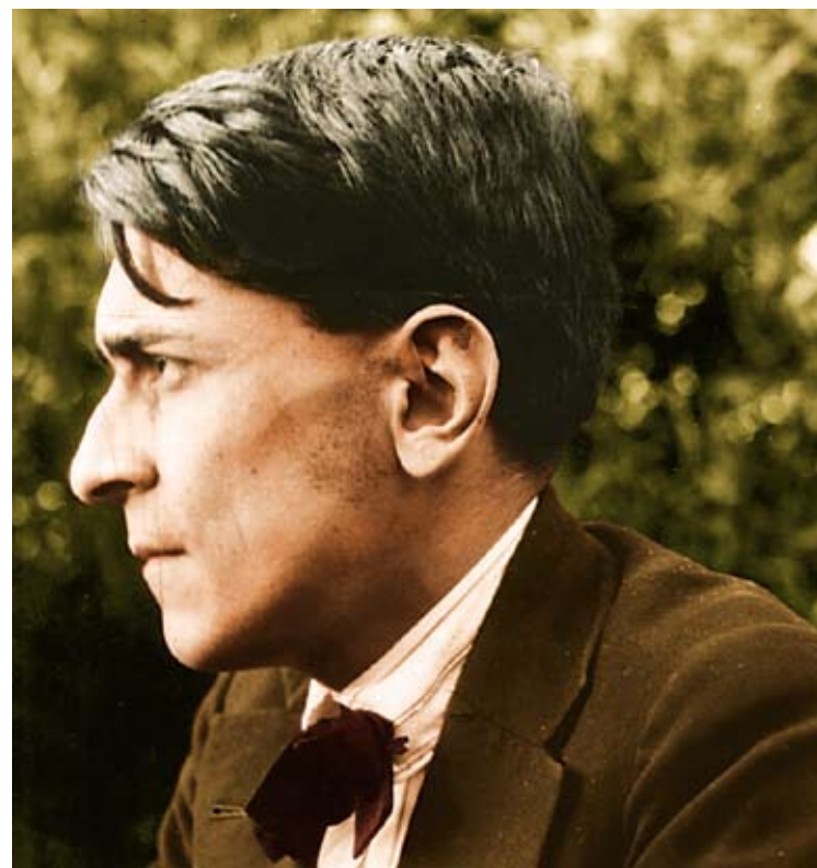
El pensamiento social del autor de los "Siete ensayos de interpretación de la realidad peruana" sigue vigente.

El maestro que se adhiere al cambio social está en el deber de impulsar, en su diaria labor, la combinación del trabajo productivo con la enseñanza. Es así como logrará promover discípulos calificados de pensamiento y acción, plenamente realizados en su formación integral, garantía para que puedan cumplir con espíritu crítico, eficiencia y dignamente su gestión generacional. El maestro consciente de su rol histórico, tiene que estar en permanente renovación de ideas, métodos y conceptos pedagógicos. Partiendo del principio de que "todo lo humano es nuestro", debe asimilar y desarrollar en nuestro medio los adelantos científicos y tecnológicos. Debe elevarse cualitativamente internalizándose en nuestras ricas tradiciones, logrando una formación panorámica y universal, muy distinta y distante del hombre tubular. Un maestro de espíritu tubular y retinero producirá discípulos mediocres y estériles. En cambio un maestro de espíritu renovador e inmensamente humano, forjará discípulos de pensamiento afirmativo y fecundo, creativo e imaginativo. Es decir,